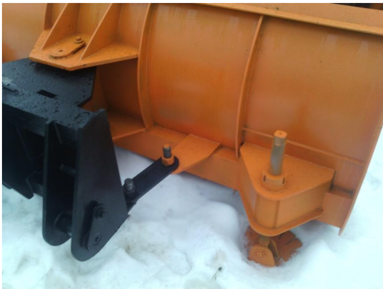
Тяги механического поворота и регулируемая тарельчатая опора.

Переднее навесное оборудование окрашивается двухкомпонентной грунт-эмалью АК-1095, которая предназначена для использования в качестве глянцевого финишного покрытия металлических поверхностей, подвергающихся воздействию атмосферы и агрессивных сред. Финишное покрытие позволяет успешно противостоять механическому воздействию и влиянию агрессивных жидкостей и химических соединений на материал оборудования.