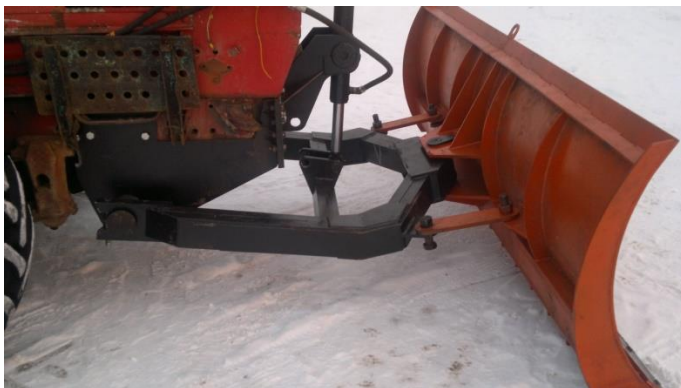
Т-150 с установленным навесным устройством, рамкой отвала и отвалом.