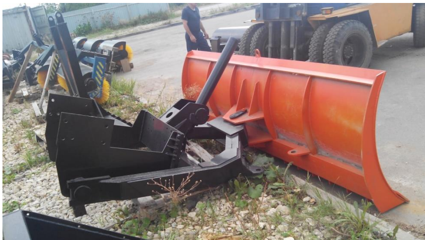
Отвал Т-150 в сборе.